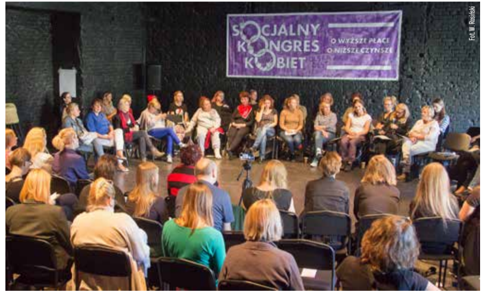
Obrady II Socjalnego Kongresu Kobiet

Kolejnym istotnym problemem jest to, że osoby zatrudnione w jednostkach budżetowych są systemowo dzielone na te, które otrzymują wyższe płace i te pracujące za głódowe stawki. W szpitalach nierówności płacowe są sformalizowane za pomocą ustaw, np. wprowadzonej niedawno ustawy o pracownikach medycznych. W ten sposób roz-