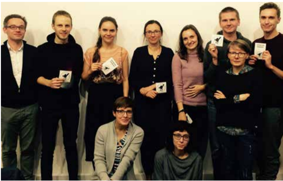
Komisja Inicjatywy Pracowniczej na Uniwersytecie Jagiellońskim

Walka z uśmiecieniem umów, częstsze waloryzacje pensji, otwarcie zakładowego żłobka, przejrzyste zasady awansu i wsparcie psychologiczne dla pracowników i studentów – to postulaty komisji zakładowych z Uniwersytetu Wrocławskiego i Uniwersytetu Jagiellońskiego