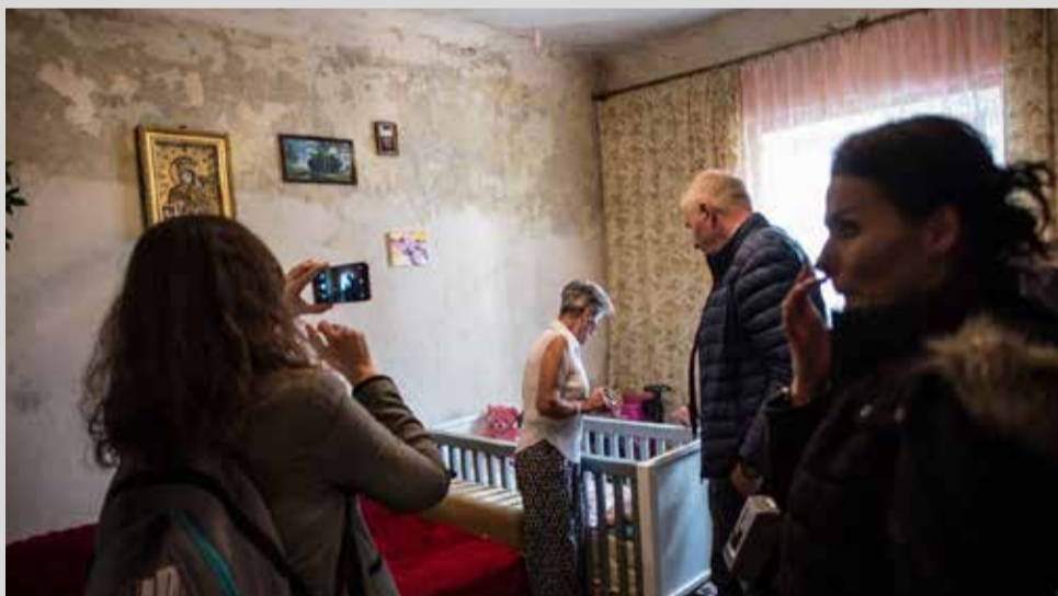
Obchód lekarski WSL po mieszkaniu na warszawskim Kamionku (Praga Południe)

Warszawskie Stowarzyszenie Lokatorów ruszyło do walki z chorymi domami i chorą polityką mieszkaniową. Zespół lekarzy, mykologów i mikrobiologów bada stan zdrowia mieszkańców i stan chorych domów komunalnych bez C.O. To wielka pomyłka, że władze dają uboższym osobom najdroższe urządzenia do ogrzewania. Zmagasz się z podobnym problemem? Grzyb, pleśń, wilgoć i chłód pogarszają Twój stan zdrowia? Zgłoś się do WSL lub swojej lokalnej organizacji lokatorskiej, wyślij zdjęcia, zbierz dokumentację, dołącz do walki.