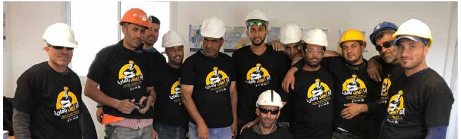
Palestyńscy robotnicy budowlani na szkoleniu z BHP zorganizowanym przez WAC MAAN

Nowo powstałe państwo Izrael stworzyło korporacyjny ład stosunków pracy, którego głównym celem było utrzymanie „jedności narodowej” i wyciszenie konfliktu klasowego. Aktywną rolę w budowie tego ładu odegrał Histadrut, który poprzez zależne od siebie firmy był nie tylko związkiem zawodowym, ale i największym pracodawcą w kraju. Z członkostwem w Konfederacji było także związane