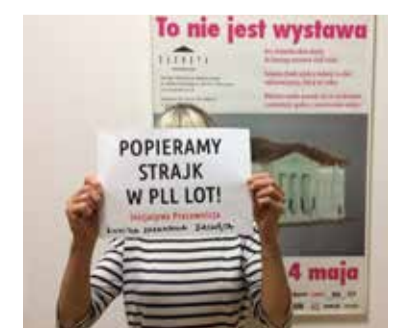
Wyrazy wsparcia dla strajku w LOT od komisji IP na Uniwersytecie Wrocławskim i w warszawskiej Zachęcie