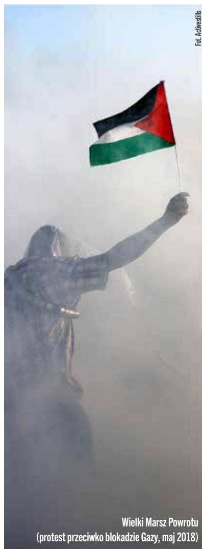
Wielki Marsz Powrotu (protest przeciwko blokadzie Gazy, maj 2018)

Taka relacja pozwala Izraelowi na utrzymywanie palestyńskiej gospodarki w stanie zależności i czerpania zysków z jej zasobów. Izrael narzuca Autonomii nie tylko wysokość ceł, ale także walutę i poziom podatku VAT, co skutkuje dramatycznie wysokim poziomem cen. Woj-