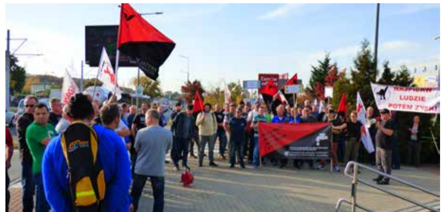
Protest komisji IP w Miejskich Wodociągach i Kanalizacji (Bydgoszcz, 16.10.2018)

Inicjatywa Pracownicza wraz z innymi związkami zawodowymi wniosła do dyrekcji przedsiębiorstwa Miejskie Wodociągi i Kanalizacja w Bydgoszczy Sp. z o.o. wniosek o rozpoczęcie rokowań w sprawie zmian zakładowego układu zbiorowego pracy (ZUZP). Wobec braku odzewu ze strony pracodawcy 16 października zorganizowano pod siedzibą spółki protest. Wzięła w nim udział ponad setka pracowników. Przybyli także delegacje związku z Poznania i Warszawy. Protest poparła zakładowa Solidarność.