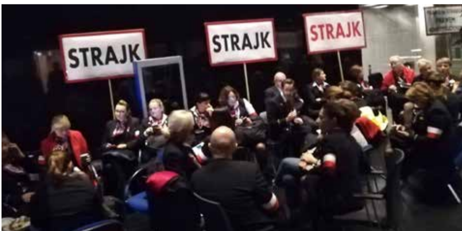
Pierwszy dzień strajku w PLL LOT (18.10.2018)

Tak lotniska, jak i linie lotnicze coraz bardziej przypominają więc miejsca pracy takie jak magazyny Amazona czy branża usług sprzątających w sektorze publicznym. Otwiera to jednak także perspektywę na wzrost liczby konfliktów pracowniczych i strajków. A, jak wiadać po przykładzie strajku w LOT, mogą to być konflikty o kluczowym znaczeniu dla całej gospodarki. ●