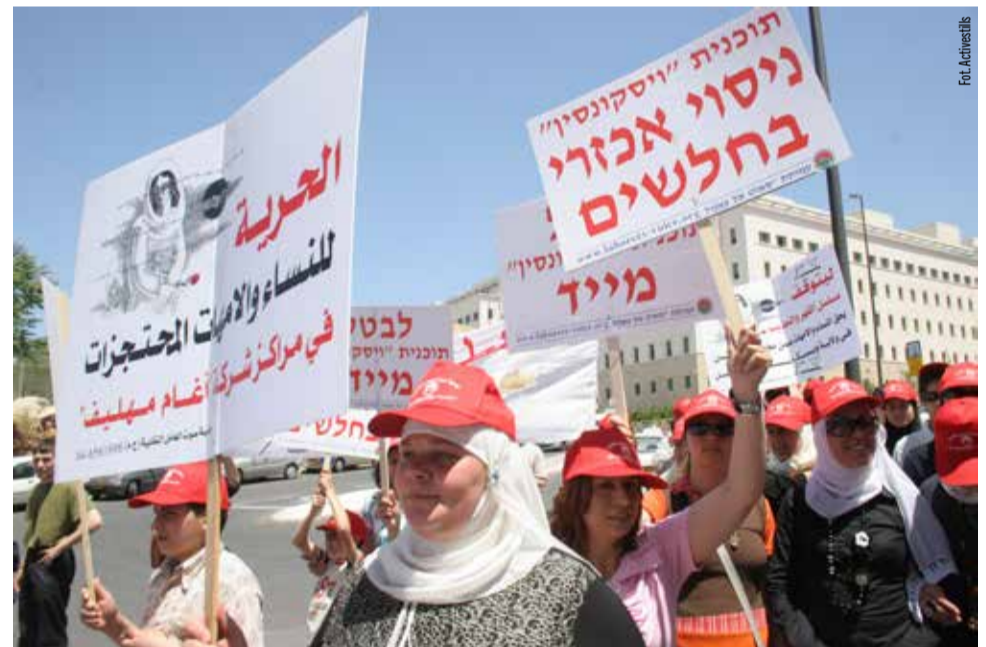
Protest WAC MAAN przeciwko „Planowi Wisconsin” ograniczającemu zasiłki dla bezrobotnych (Jerozolima Zachodnia 2006 r.)

Od 2002 r. główne izraelskie osiedla są odgradzane od palestyńskich miast i wsi „Murem Apartheidu” (systemem ogrodzeń, betonowych murów i zasieków z drutu kolczastego) oraz eksterytorialnymi drogami łączącymi je z Izraelem. Ruch drogowy pomiędzy palestyńskimi enklawami kontrolowany jest przez ok. 100 stałych posterunków wojskowych (checkpoinów). Żydowskie osadnictwo ma izraelskie obywatelstwo i korzystają z pełni praw obywatelskich, natomiast mieszkający tuż obok Palestyńczycy są bezpaństwowymi rezydentami, których życie regulują rozkazy okupacyjnego wojska.