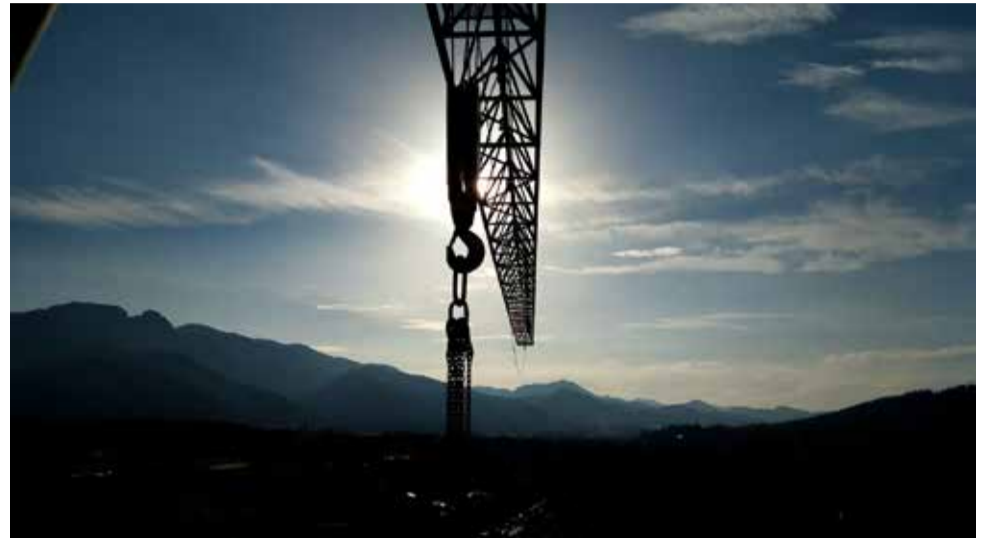
Widok z kabiny żurawia wieżowego

6) informacje o przemieszczaniu ładunku przy użyciu więcej niż jednego żurawia.