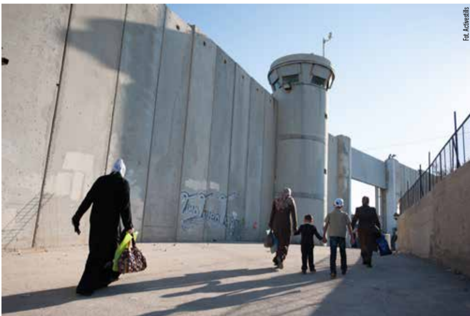
Izraelski checkpoint wojskowy i Mur Apartheidu w Betlejem

załamałyby się tak jak ten południowoafrykański. Z jednej strony Izrael jest największym odbiorcą pomocy wojskowej ze Stanów (3 mld USD rocznie), z drugiej – jego najważniejszym partnerem handlowym jest UE, na której rynek trafia 1/3 izraelskiego eksportu. W powiązaniach tych kluczową rolę odgrywają „testowane w walce” (czyli na Zachodnim Brzegu i w Gazie) broń, uzbrojenie, techniki pacyfikacji protestów społecznych i inwigilacji, które są głównym towarem eksportowym Izraela – w 2017 r. zajmował on 5 miejsce na liście globalnych eksporterów broni i wydał na zbrojenia 4,7% PKB